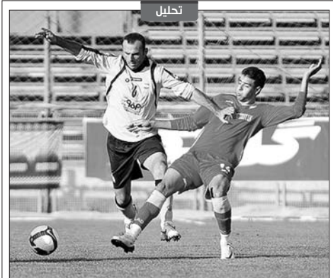
سپاهان در اهواز و استقلال در بوشهر